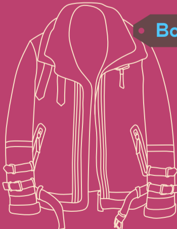
• Bomber B3