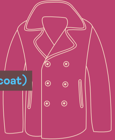
• Caban (pea coat)