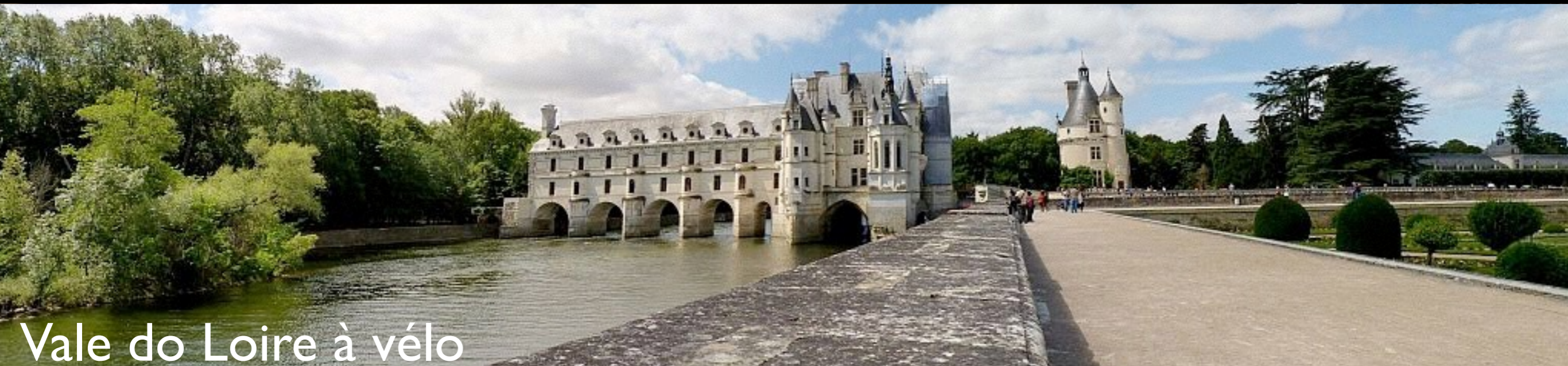
Vale do Loire à vélo