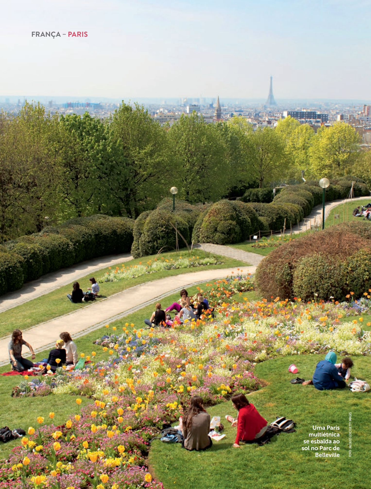
Uma Paris multiétnica se esbalda ao sol no Parc de Belleville